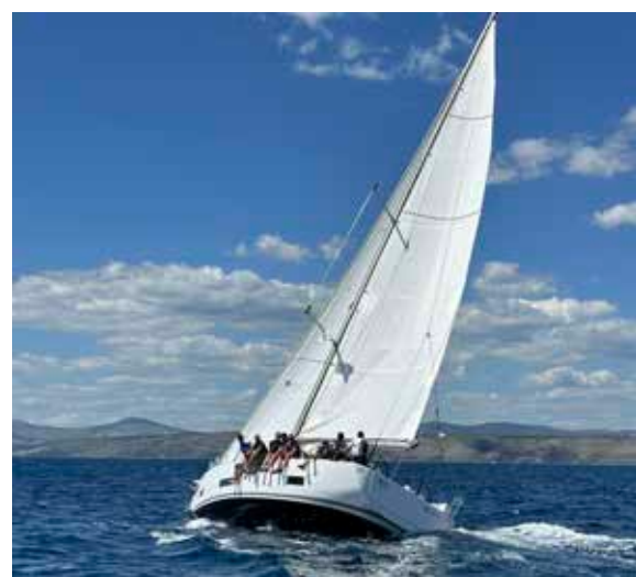
Team WaCoS in voller Aktion