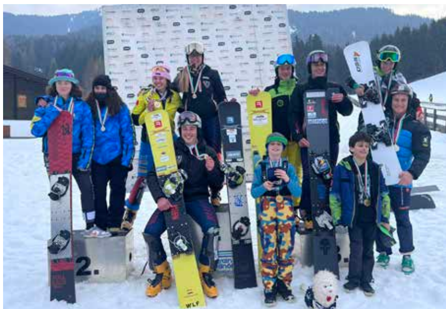
Italienmeisterschaft beim Fillerlift

Ein Highlight der heurigen Saison war die Italienmeisterschaft, welche vom 08.02. bis zum 09.02.2024 beim Fillerlift ausgetragen wurde. Es waren ungefähr 150 AthletInnen aus 14 verschiedenen Nationen am Start. Dabei konnten die Villnößler Athleten ihren Heimvorteil nutzen und einige Siege in ihren Kategorien feiern. Einige von ihnen brachten sogar den Italienmeister-Titel nach Hause! Auch hier gilt ein großes Dankeschön dem Ausschuss und den freiwilligen HelferInnen.