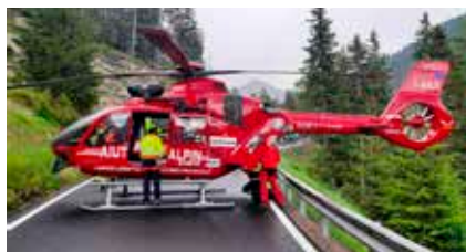
Mit dem Helikopter des Aiut Alpin: Perfekte Landung auf der Zanserstraße.