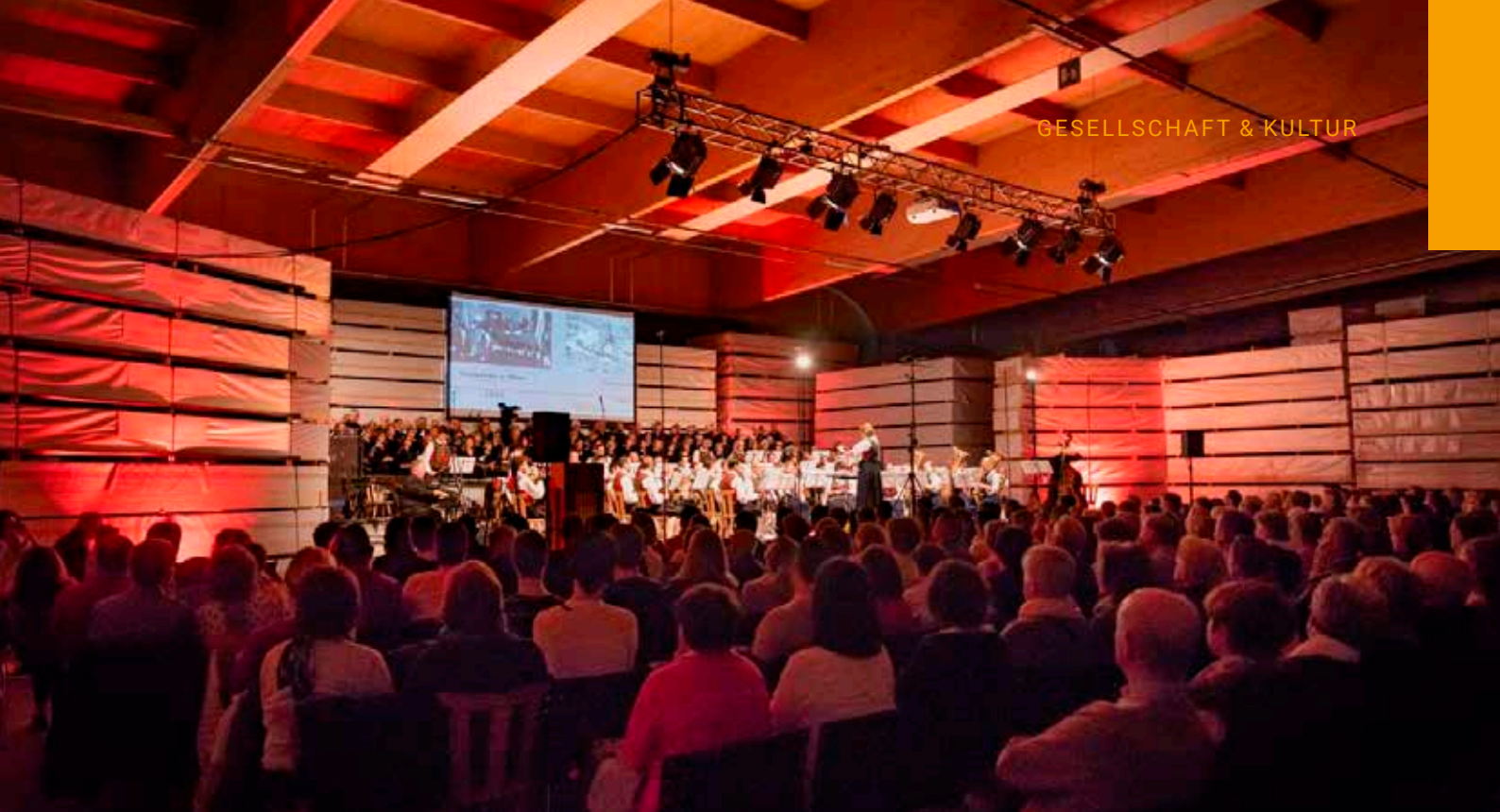
Jubiläumskonzert der Pfarrmusik Olang