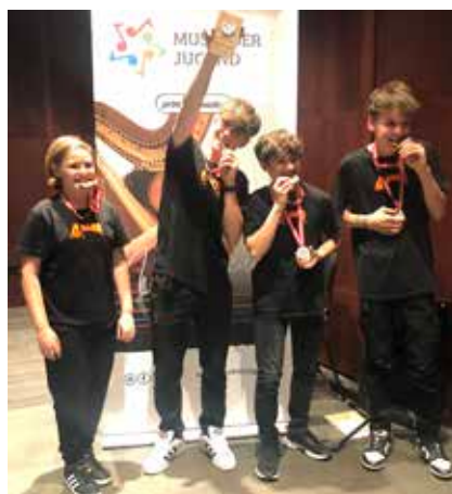
Jubel beim Bundessieg in Brixen