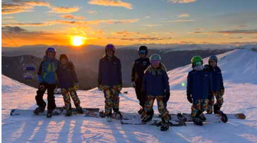
Training auf der Plose

Sektion Snowboard FSP – Die Saison begann schon im Herbst mit der Teilnahme am Gasslörggelen. Letztes Jahr fand es das erste Mal an drei hintereinander folgenden Tagen statt. Es war eine sehr arbeitsintensive Woche mit wenig Schlaf. Eine große Hilfe war die Zusammenarbeit mit den Keglern und dem Böcklverein, welche uns bei dieser Veranstaltung tatkräftig unterstützt haben.