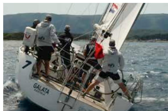
WF Mechanik mit vollen Segeln