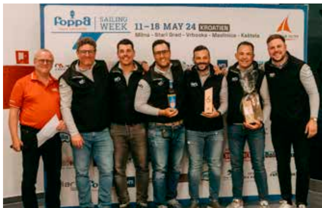
Team WF Mechanik bei der Preisverteilung