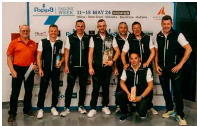
WaCoS bei der Preisverleihung