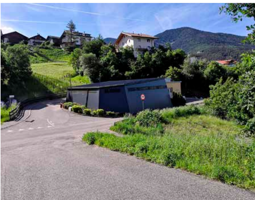
Neu überdachter Wertstoffhof in Teis

Gemeindeentwicklungsplan - Anpassung der Gesamtkosten: Der Ausschuss beschließt, das Projekt „Erstellung des Gemeindeentwicklungsprogramms für Raum und Landschaft (GProRL) mit einer geschätzten Ausgabe von 252.647 € statt der ursprünglich geschätzten 254.014 € zu genehmigen. Weiters wird beschlossen, die Helios GmbH aus Bozen mit der Kommunikation für insgesamt 12.627 € zu beauftragen sowie die Firma Kohl & Partner Südtirol aus Gais mit dem Programm für die Entwicklung des Tourismus gemäß Angebot für insgesamt 23.980 € zu beauftragen.