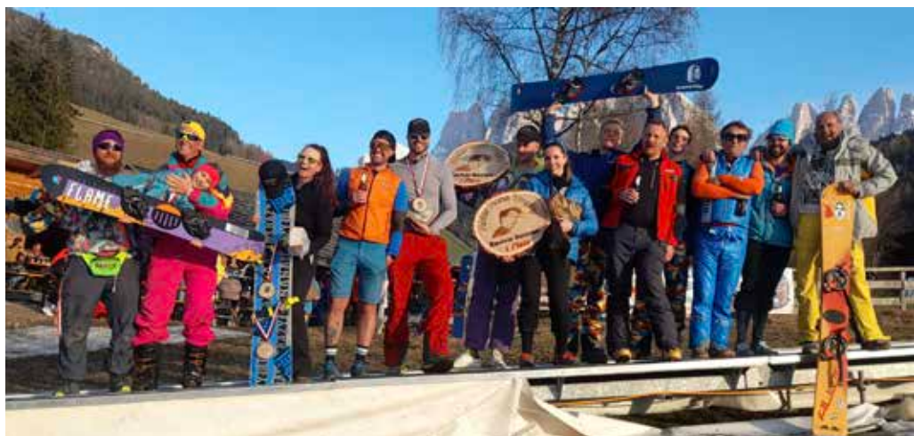
3. Hofer Hons Trophy