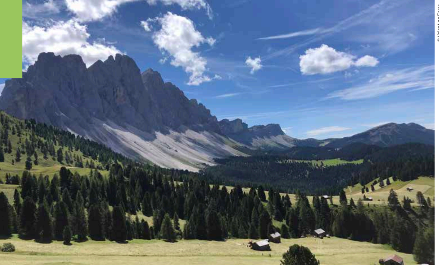
Die Geisler in all ihrer Pracht