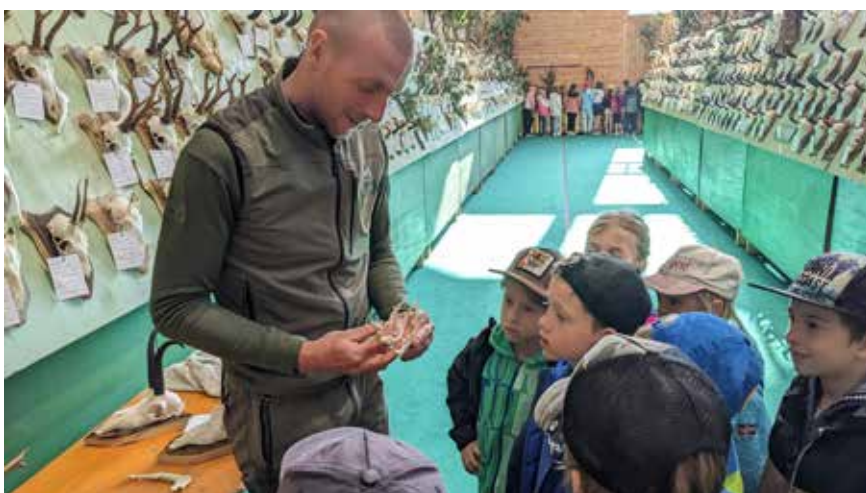
Hegeschau in St. Peter Villnöß