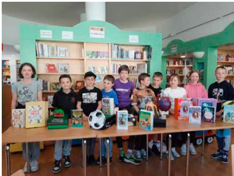
Kreative Buchpräsentationen der SchülerInnen der 5. Klasse von St. Peter

Bibliothek – Die Öffentliche Bibliothek plant immer wieder Veranstaltungen, die der Leseförderung dienen und zudem auch Spaß machen sollen. Eine solche Aktion ist die jährliche Sommerleseaktion „Biblio Bingo“, die in Zusammenarbeit mit der Mittelpunktbibliothek Brixen organisiert wird.