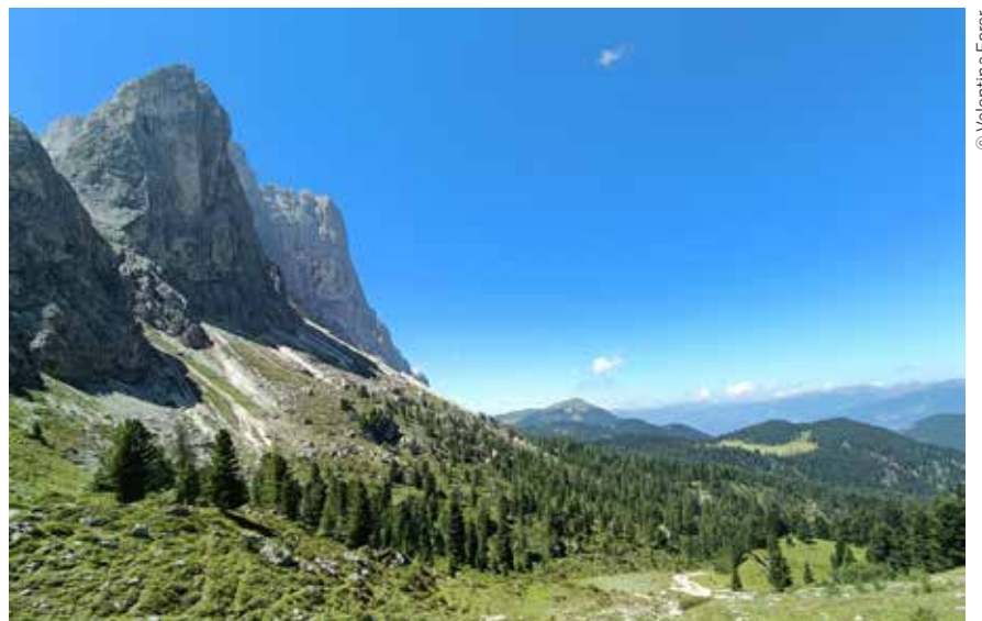
Unterwegs Richtung Kreuzjoch

Vom 16. bis 18. August 2024 erwartet euch eine dreitägige Ausstellung zu den Pilzen der Wälder Südtirols. Mit zahlreichen Exponaten und fachkundiger Auskunft durch Mitglieder des mykologi-